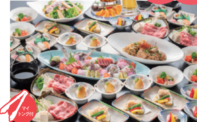
※写真は5名様盛りです。