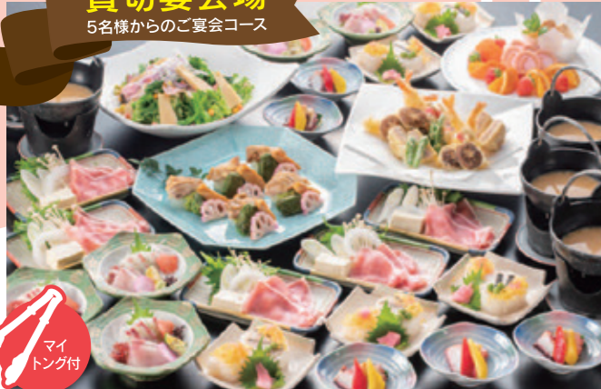
※写真は5名様盛りです。

瓶ビール、日本酒、焼酎、 ウイスキー、ハイボール、 梅酒、チューハイ、 ソフトドリンク、 ノンアルコールビール、 ノンアルコールカクテル